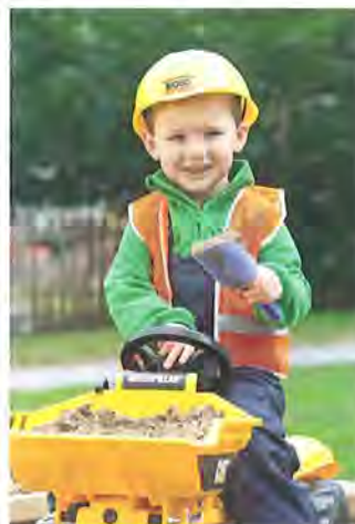
Einmal, da waren wir alle Infrastrukturbauer.

Wesentlich zum erfreulichen Abschluss der wechselvollen Geschichte der Westumfahrung Zürich beigetragen haben nicht