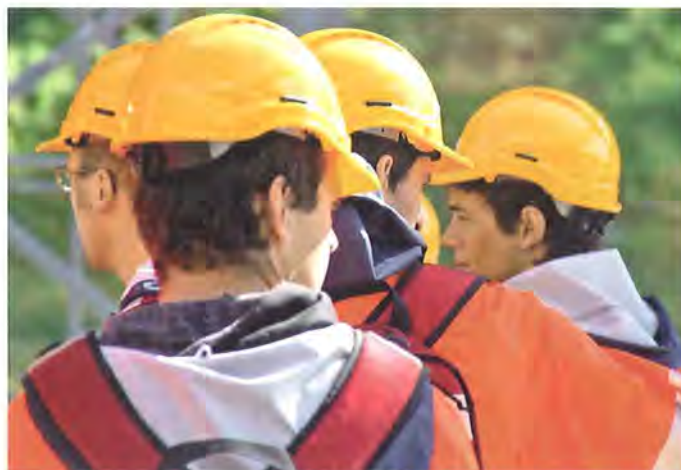
Der Infrastrukturbau ist nicht nur ein volkswirtschaftlich bedeutender Wirtschaftszweig – gegen 8 Milliarden Franken werden im Tiefbau jährlich umgesetzt –, auch finden hier viele Jugendliche eine Lehrstelle und später ihr Auskommen.

Das Engagement lohnt sich. An den Festivitäten im Autobahndreieck Filderer bei Wettswil werden je nach Witterungsbedingungen zwischen 100 000 und 200 000 Besucherinnen und Besucher erwartet. Wie das Projekt «Westumfahrung Zürich» ist auch das WestFest keine rein zürcherische Angelegenheit.