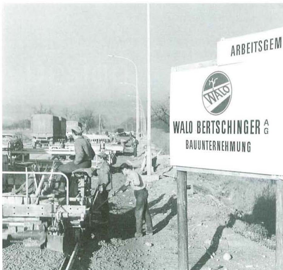
Keine Erfindung unserer Tage: Die ARGE Walo-Spaini baute 1958 eine Betonstrasse in Pratteln.

Überschätzen wir die Rolle der Arbeitsgemein-