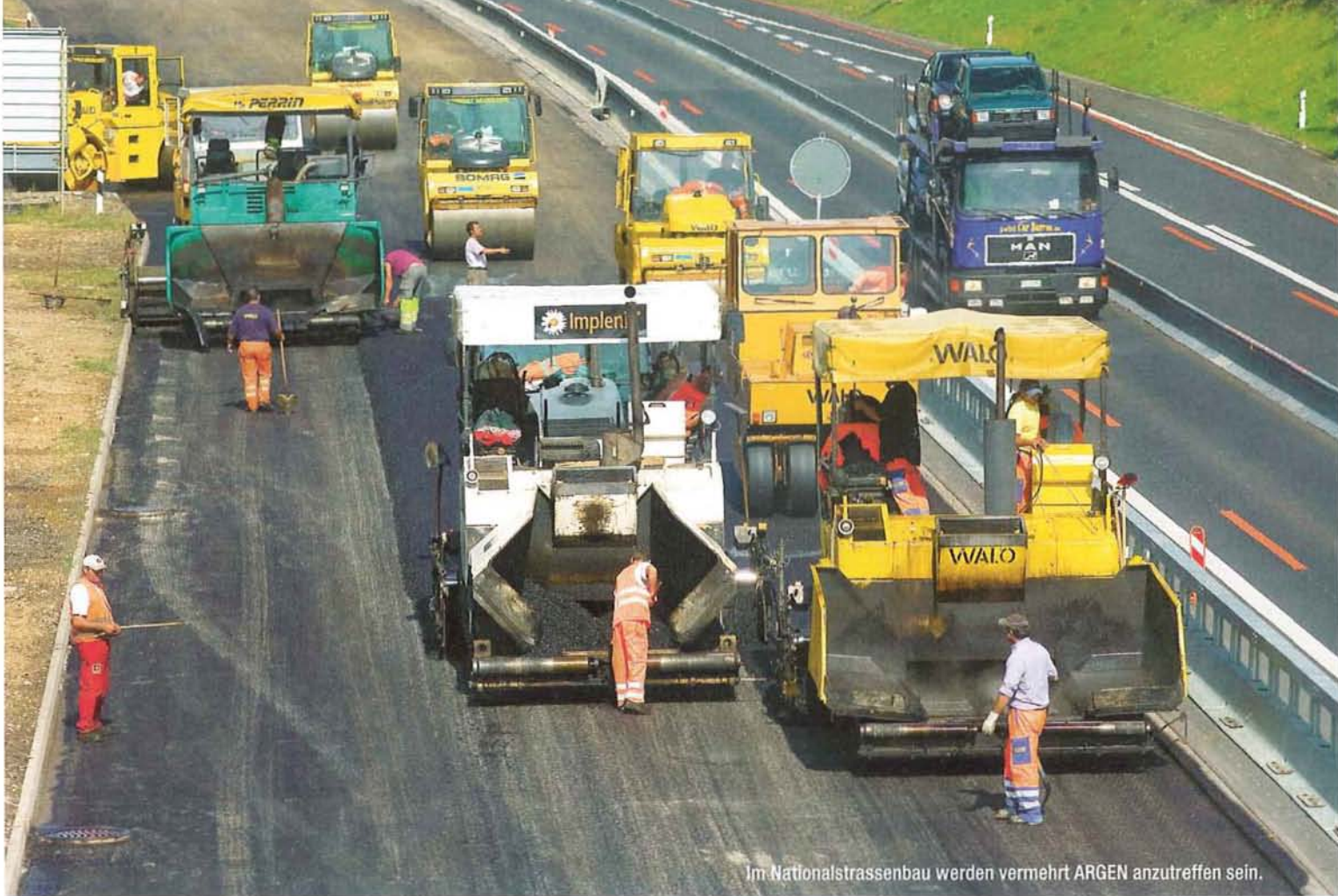
Im Nationalstrassenbau werden vermehrt ARGEN anzutreffen sein.

Über die Bedeutung von Arbeitsgemeinschaften im Strassenbau